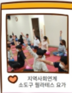
지역사회연계 소도구 필라테스 요가