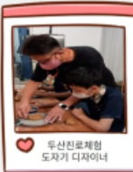
두산진료제임 도자기 디자이너

1318해피존이 22년 사회복지 현장실습 신규기관으로 선정되었습니다. 7월 사회복지 현장실습생을 모집하여 총 4명이 22년 현장실습생으로 함께 하게 되었습니다. 새로운 선생님들과 수업을 함께 한다는 것이 설레기도 하고 어색하기도 했지만 아이들에게 먼저 다가가서서 다양한 이야기를 나누고 수업을 함께 참여하면서 빠른시간에 친밀감을 형성하는 모습을 볼 수 있었습니다. 아이들이 귀가한 후 센터 내에서 사회복지 현장 교육 및 다양한 프로그램, 실습과제 등을 함께 이야기 나누며 생생한 실천현장의 경험을 나누는 기회가 되었습니다.