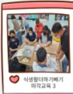
식생활터지기예 미각교육 3