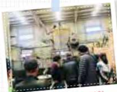
재활용사업단 선진지 견학