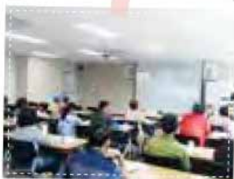
세차 직무교육 0618~0620

세차사업단 5명의 참여자는 지난 6월 18일(월)부터 6월 20일(수)까지 창원문성대학교 및 김해지역자활센터에 실시되었던 2018년 상반기 직무능력향상 교육 및 자격증 과정을 수료하였습니다. 참여자 중 4명은 지난해 3급에 이어 회오리세차 마스터 2급을 취득하였고, 1명은 신규로 회오리세차 마스터 2급을 취득하는 성과가 있었습니다.