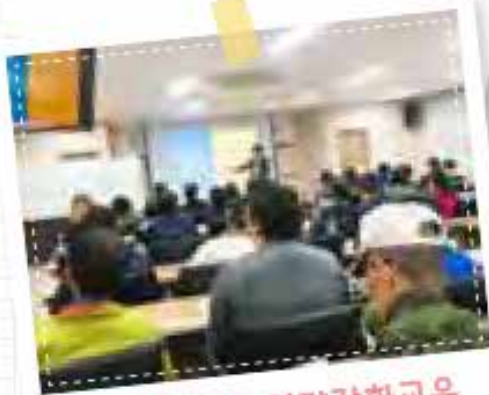
참여주민 자립역량강화교육 1차 0403, 2차0612

이번 교육을 통해 참여주민 간 긍정적인 의사소통으로 갈등 관리에 대한 역량향상에 도움이 되었습니다. 또한 기질검사로 나의 강점을 찾고 일에 대한 자긍심을 향상시켜 적극적인 자활사업 참여가 가능해 졌습니다.