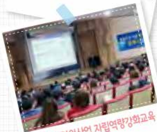
자산형성지원사업 자립역량강화교육 1차 0426, 2차 0515