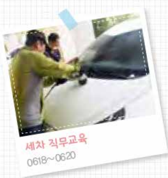
세차 직무교육 0618~0620