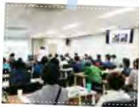
부업사업 상반기 직무교육

일꾼사업단 참여주민들이 6월 15일, 25일 두 차례에 나눠 부업사업 상반기 직무 능력향상 교육훈련과정에 참여하였습니다. 이번 교육은 창원문성대학교에서 실시하였는데, 3정5S 실천 교육에서는 항상 솔선수범하는 행동이 곧 3정5S를 실천한다는 생각으로 업무에 임하는 것이라 배웠습니다. 무엇보다도 교육환경의 만족도가 최고였던 즐거운 교육이었습니다.