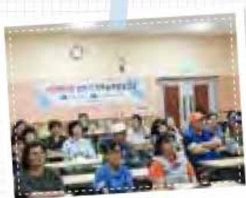
수공예사업 직무교육 0626

경남사회복지센터에서 6월 26일 커피 큐브사업단, 아쿠아물사업단 및 실무자 총 인원 8명의 참여주민들이 「경남지역 자활사업 활성화를 위한 SNS를 활용한 마케팅 실전」이라는 주제로 소셜네트워크 시대의 마케팅과 소비자의 변화, 광고의 변화 등 진정성 있는 콘텐츠에 대한 내용으로 페이스북 실습을 진행하고 활용해 보는 시간을 가졌습니다.